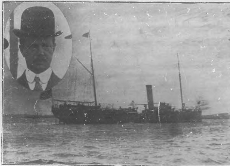
El crucero americano "Dolphin" que trajo á la Habana al Secretario de la Marina de los E. E. U., y retrato del Secretario.

Con el General Gómez asistieron á la fiesta las primeras autoridades de la Habana y las de Marianao; y numerosa concurrencia que se daba cuenta de la importancia del acto y que alababa como es merecido el comienzo de la humanitaria obra.