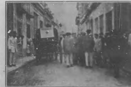
Escena de las elecciones efectuadas celebradamente el día 1.