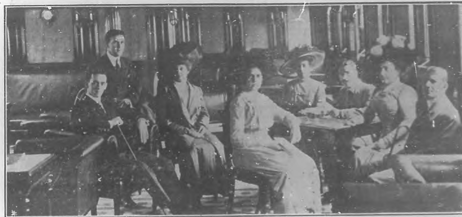
A BORDO DEL "ESPAGNE".—El fumador.

La bahía de la Habana ha sido teatro de dos "actualidades" de bien distinta clase. Dos barcos la han dado.