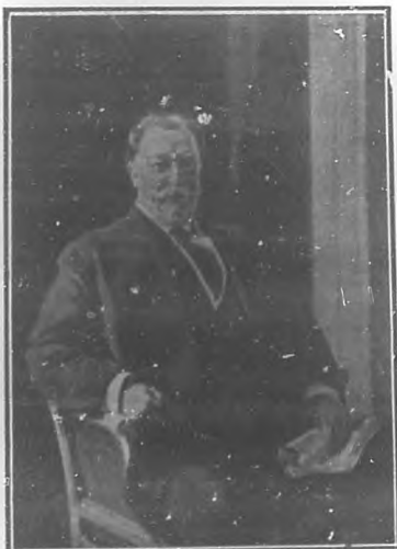
Mr. TAFT.—Por J. Sorolla.