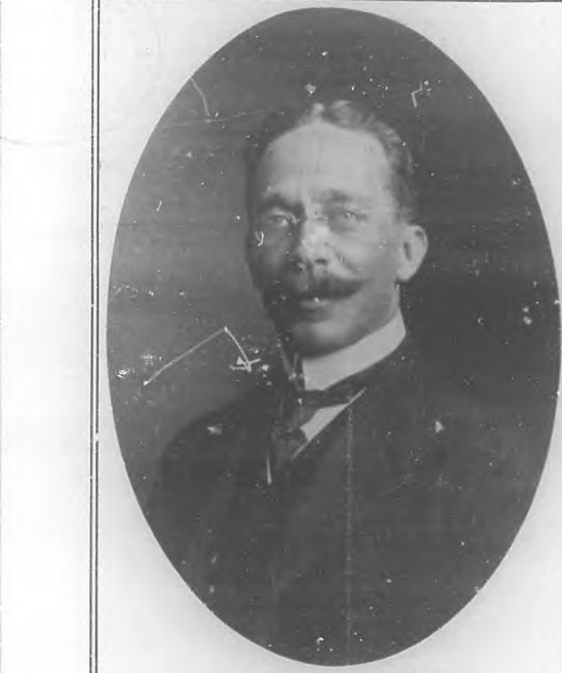
Sr. D. Antonio Martín Rivero, E. E. y Ministro Plenipotenciario de Cuba en Holanda

SEMPER Por inflexible ley encañonado, el arrogante mar, que horror evoca, en la insensible arena y dura roca sus ondas quiebra, en ritmo acelerado. Que allá, segura en alto acantilado, floresta sonriente lo provoca, y por llegar allá, sus ondas loca, surge, en líquidas montes transformado. Cual titanes lanzados á la carga, el seco jarallón las olas batea, escalan, rompen... y entre espuma amarga, flores y tierra y árboles abaten... ¡Mas, sólo abraza el mar, con honda pena, ásperas rocas, insensibles arena! LA PLUMA FUENTE Ocultando en su seno, la pluma fuente, Negra tinta, ¡tan negra como mi pena! La extendiódrá en frases bellas que odena Suntuosa é los antojos del escribiente. A veces traza rimas de amor ardiente, O pinta la amargura que el pecho llena; Otras veces esboza la paz serena, O la aridez de un alma que ya no siente... ¡Identico parece nuestro destino! Pues cediendo á una fuerza avasalladora, Lleva á malicia el hombre su triste sino... Amor, aborreo y luego... rendido ahora! Mas, cual pluma de fuente que está agotada, Calta, exhausto, en la meta de la jornada. Antonio Martín Rivero.