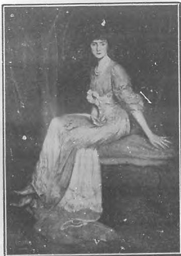
SRA. M.—Por Antonio de la Gándara.