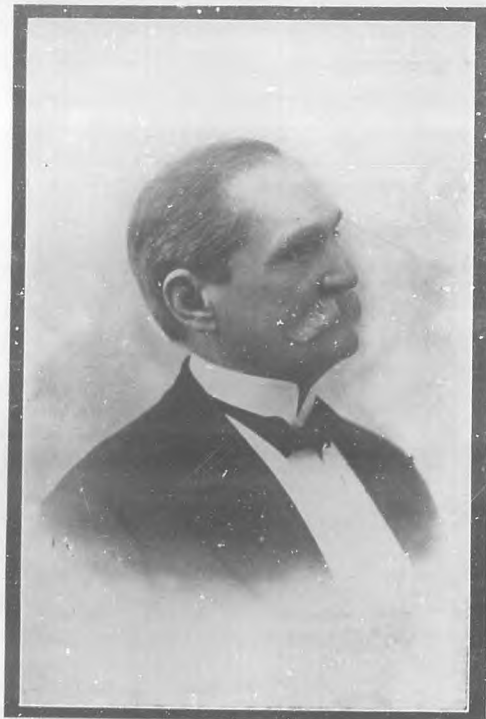
D. TOMÁS ESTRADA PALMA

BOHEMIA rinde tributo á la memoria del venerable "Don Tomás" primer Presidente de la República Cubana, ciudadano ejemplar y gobernante prototipo de honradez y moralidad, con motivo del segundo aniversario de su fallecimiento; y honra sus páginas con la publicación del retrato de aquel que, pasada la época en que las pasiones políticas se desbordaron, es hoy recordado con respeto por todos.