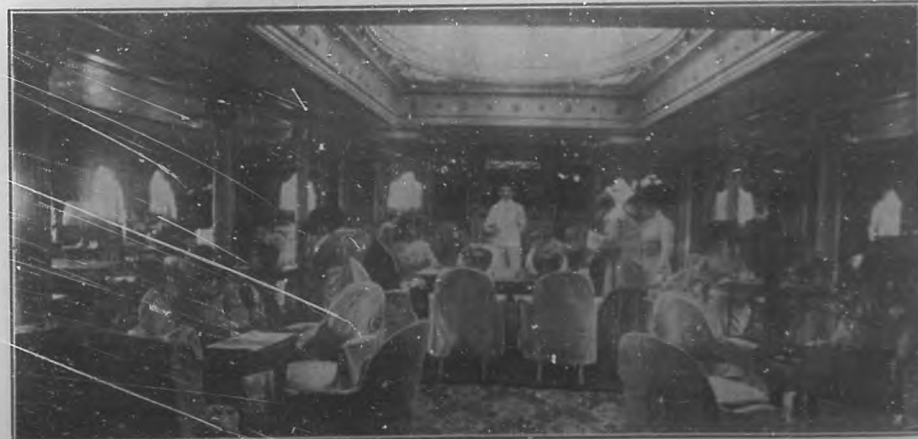
A BORDO DEL "ESPAGNE".—Un salón.