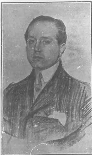
MARTINEZ RUIZ (Azorín).