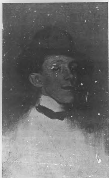
ALFONSO XIII.—Por R. Casas.