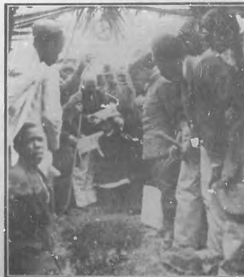
Las casas para obreros.—Colocación de la primera piedra.

La fiesta con que la "Compañía Transatlántica Francesa" celebró la llegada del magnífico vapor "Espagne" es de las que dejan recuerdo tan grato como duradero.